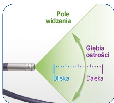
Prosty obiektyw optyczny

(2) Oznacza końcówki o maksymalnej jasności.