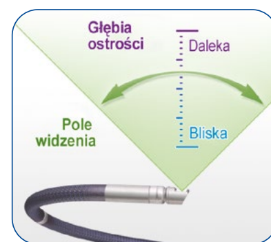
Boczny obiektyw optyczny

Everest Polska od lat dostarcza Państwu sprzęt do Zdalnych Badań Wizualnych. Produkty zawsze najwyższej jakości i najlepszych światowych producentów – liderów w swojej dziedzinie.